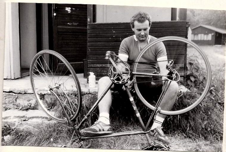
Je tohle je co? Inu vypadá to na loučeni s cyklistkou