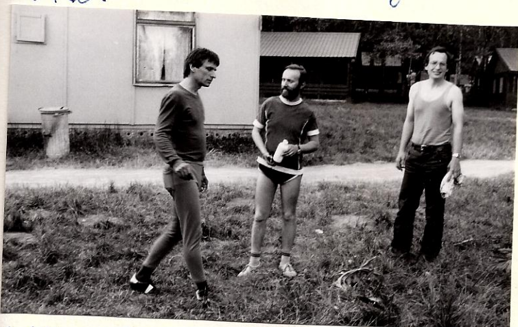
Vítězství stálo hodně psychického síly.