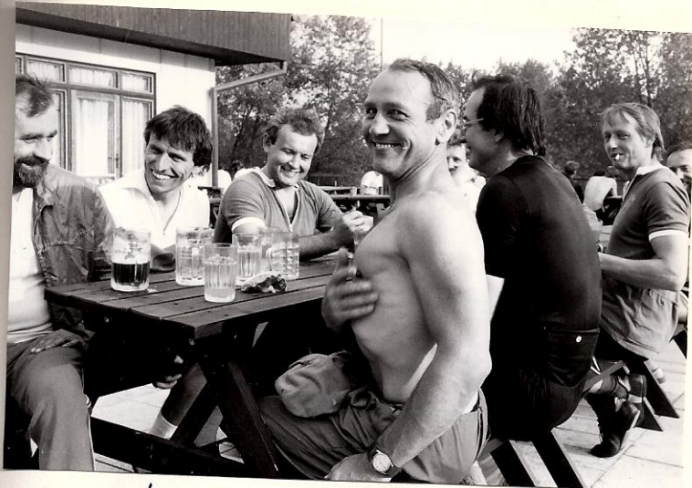
Už kroměňonec měl hrudník koš. Krampal vpravo její máš jaké.