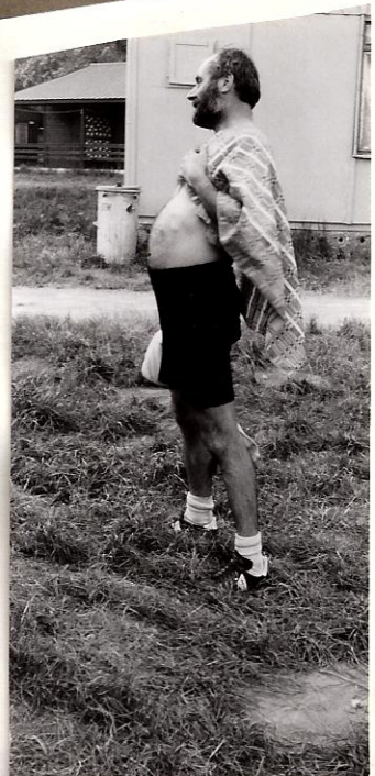
Blážený závodník krátce po dojezdu