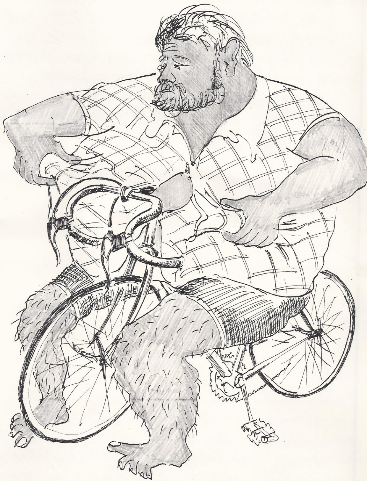
Nejzkrmenější je chudák Buko